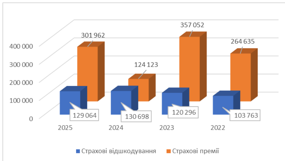
Структура страхового портфелю за 2025 р.: